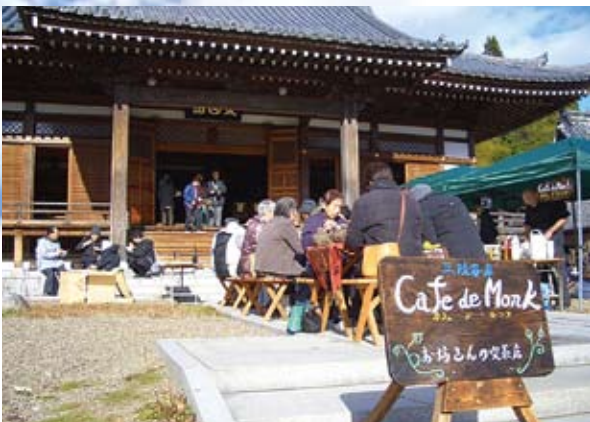
岩屋寺でのカフェ・デ・モンク活動

津波で亡くなった父親が作った花壇。三年ぶりに花を咲かせたのを見てここで父親と共に生きていく決心をした若い女性。妻、娘、孫を津波で失い、新盆に流した三個の灯籠が風と波にもまれバラバラに流れる。