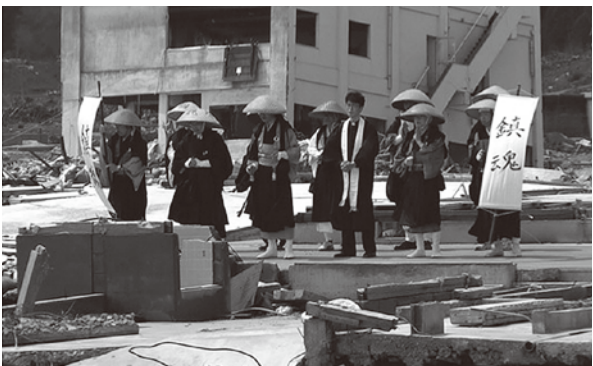
戸倉海岸での大震災49日追悼

おりました。「でも先生、ちよつとそれは早いな」と申し上げました。まず被災地の支援が第一でしたし、それに資金の用意、大学とのコンセンサスも出来ていない。しかし考えてみたら、先生の命は本当にわずかしが残つていなかった訳で、在宅医療の先駆者として看取りの現場で宗教者とタッグを組む。この仕事を終えて生から死に向かいたかつたのだと思います。