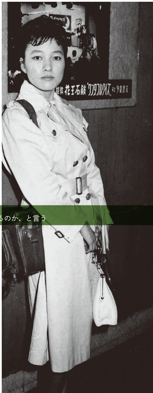
「スウィングジャーナル」に原稿を書き始めた頃

協会の事務所が銀座にあったので、そこへはよく顔を出していました。お仕事のこととか、勉強に行ったりしていたんですけど、今のデパートの松屋近くに金馬車というキャバレーがあって、金馬車の前を通って松屋の先をちよつと築地のほうに曲がったところにその事務所があったんですね。金馬車は夕方の五時四十五分ぐらいまでダンスホールになる。