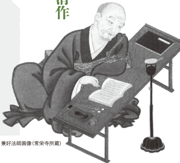
兼好法師画像(常栄寺所蔵)