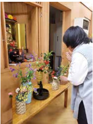
手まり学園のお釈迦さまに合掌

例えば、子どもは小さな虫、花、どんな命でも自然に慈しんだりしていることに私は気付いたんですね。大人が眉をひ