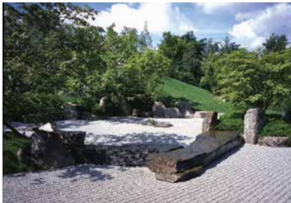
『融水苑』ドイツベルリン日本庭園

経済の停滞はまだつづくでしょう。そのなかで職を失ったり、収入が断たれたりするなど、苦境に立たされることもあるでしょう。そんなとき胸に兆すのは、「もう、どうにもならない。お手上げ状態だ」