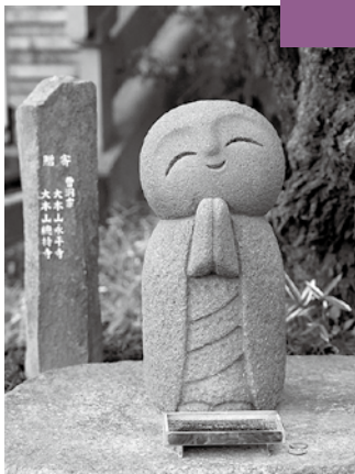
駒澤大学構内のお地蔵さま

ただし残念なことですが、コロナ禍の現在、不要不急の外出を避け、会食せず、黙食が勧められている現状です。またそのことは逆に、人間には不要不急、おしゃべりしながらの会食が欠かせないということが分かります。ちなみに雲水の食事は沈黙厳守です。それは生き物の命をいただく資格が自分にあるのかを問いつつ、仏道に精進することを誓う沈黙です。黙食は当面はコロナ対策のための外圧のように思われますが、意味づけが変われば