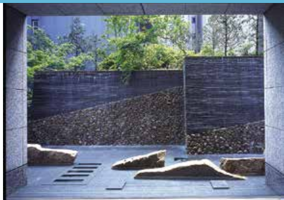
『青山緑水の庭』東京都ル・ポール麹町

ば、きちんとそのときから、仕事をする場（自宅のデスクなど）に身を置いて、精いっぱい仕事に取り組まなければ、いまあげた禅語を実践することにはなりませんね。 「マチマチ」を自分に許していると、生活リズムは崩れ、仕事への取り組みもどんどんいい加減なものになっていきます。人は易きに流れやすい