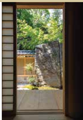
神奈川県横浜市 建功寺