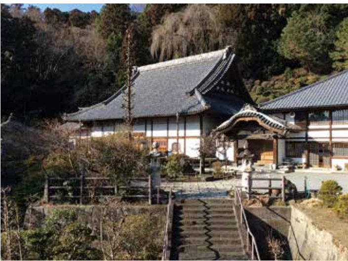
群馬県渋川市 如意山 良珊寺

ですが、残されている『瑩山清規』の記述を見ると七月一日になると「施食」を営む勝を掲げ、目連の故事に触れつつ、さらに『孟蘭