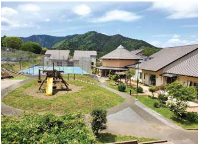
神奈川県愛川町 児童養護施設 手まり学園

そめるようなトカゲとかいろいろな虫類、そういうものを大事に自分で育てたり、話し掛けたりする。大人のほうが忘れてしまっているんじゃないかというぐらいに、慈悲の心を子どもたちはそのまま体現していると思うことがよくあります。その慈悲の心というのは、普段会っていない親に対しても向けられているような気がするのです。虐待を受けてきている子どもたちをみていて、これは不思議なことなのですが、親を信じているのです。根本的に恨んでいるなどとは思えません。しつかり親の本質というも